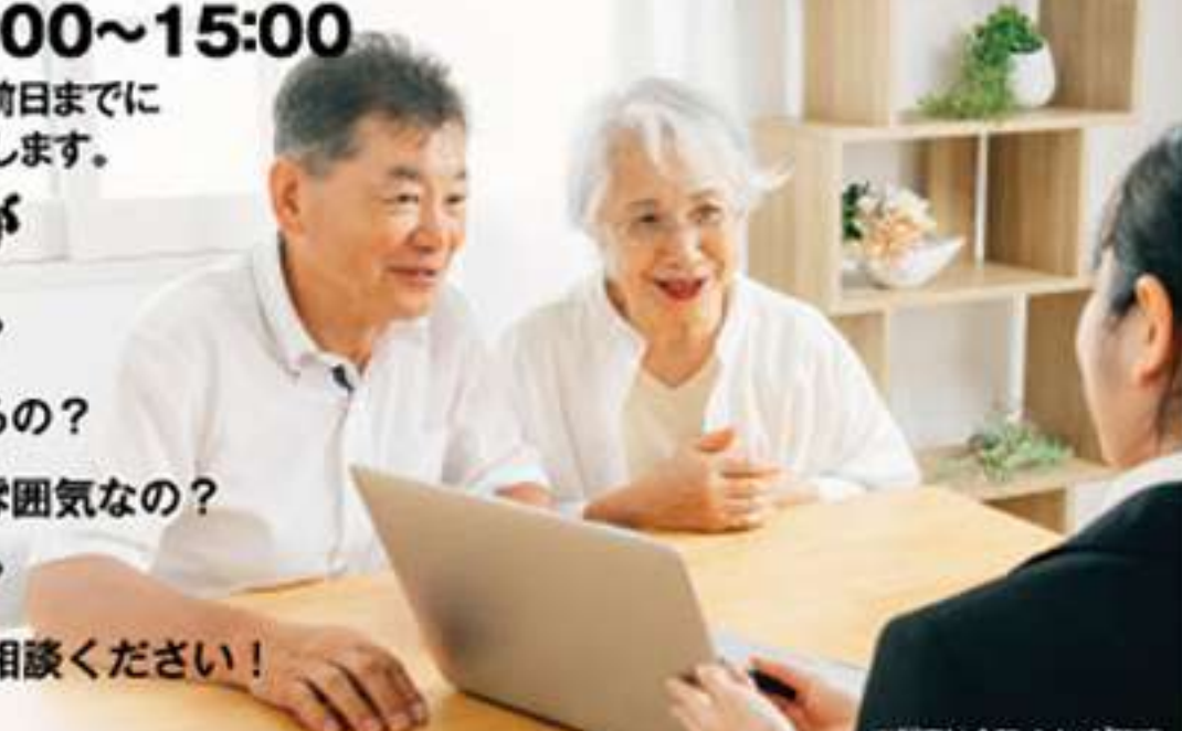
※写真は全てイメージです。